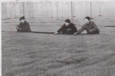
3月21日,安福县瓜畲乡田东村“育秧工厂”内,技术人员和村民正在管理水稻秧苗。田东村“育秧工厂”占地50亩,年供水稻秧苗1万亩以上。

本报崇仁讯(徐立鸣 通讯员陈佳璐)各类智慧农机在田间来回穿梭,农资经营门店内购买化肥、种子的农户络绎不绝……眼下,崇仁县春耕生产正如火如荼。作为全国商品粮基地县,该县通过完善农资筹备、落实奖补政策,推进高标准农田建设,发展全程农业机械化等措施,帮助农企、农户抢抓农时,保障春耕生产工作顺利进行。 农资齐备、补贴到位,生产需求有保障。该县全面落实国家扶持粮食生产的各项