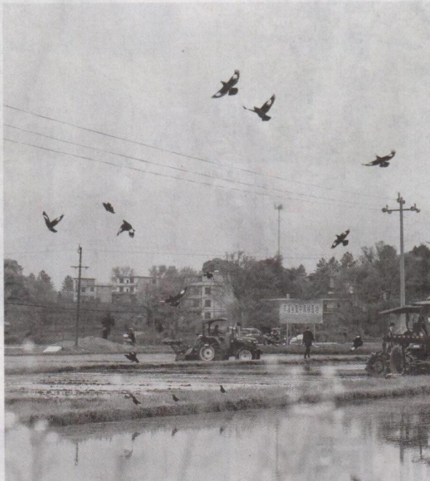
3月21日,永新县芦溪乡社园村早稻育秧基地,农户正驾驶农机翻耕稻田,抢抓农时备春耕。