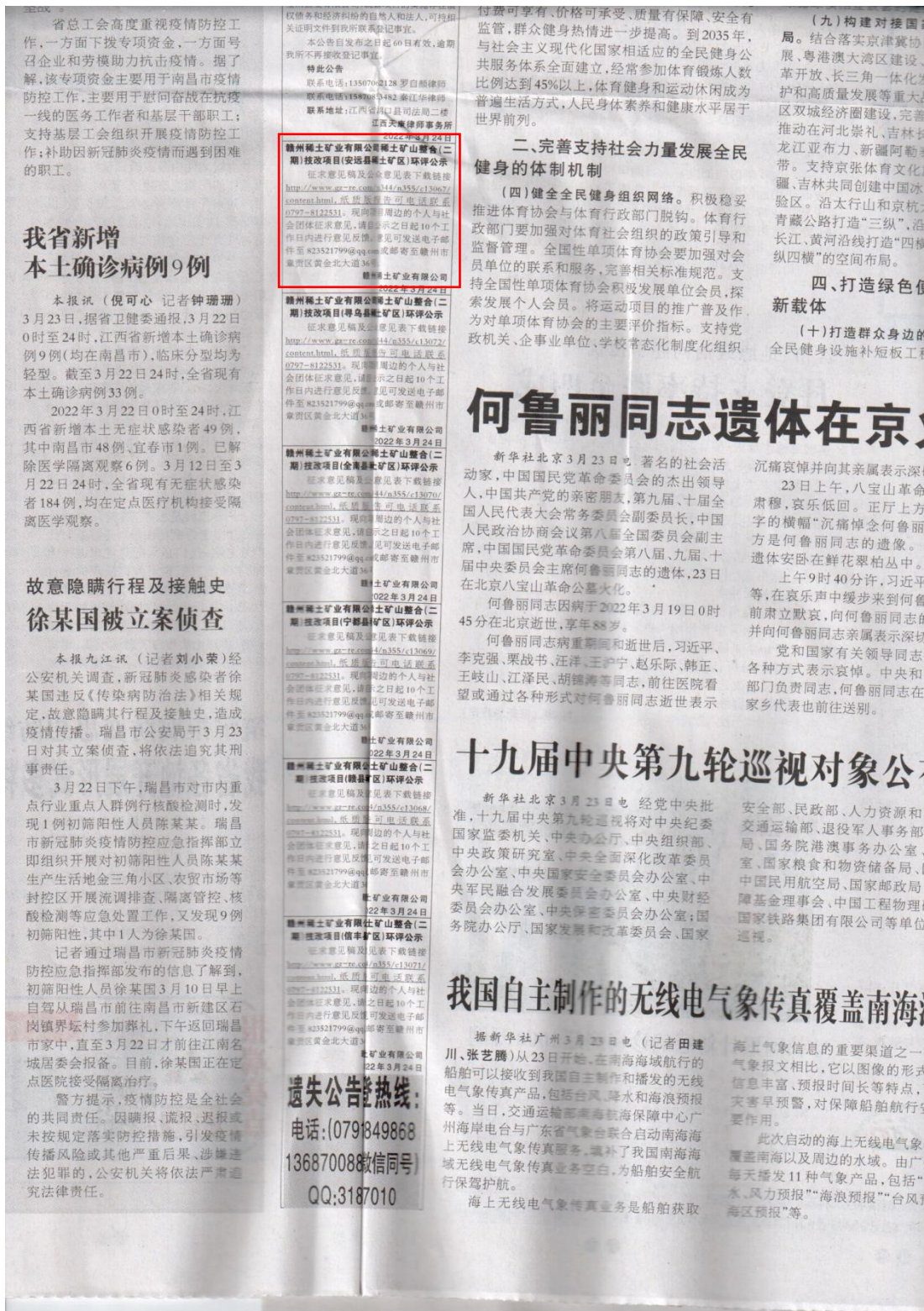
图3 第二次公众参与报纸公示（江西日报第一次公示）